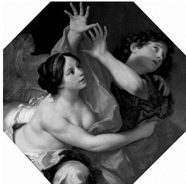
Jozef a Putifarova žena od Carla Cignani

Pre muža je sexuálne pokušenie veľkým pokušením. V tom čase mohol mať Jozef okolo dvadsaťpäť rokov, teda bolo to v čase, kedy sa u mužov nástojčivo hlási mužská sila. Jozef odmietol. „ Prečo? “ pýta sa odmietnutá. „ Pretože si jeho žena! “ (39,9) A keď domáca pani stále nechápe, odvolá sa Jozef na svoje svedomie: „ Akože by som mohol urobiť toto veľké zlo a zhręšiť proti Bohu? “ (39,9)